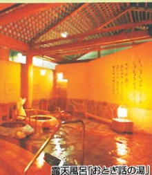
露天風呂「おどぎ話の湯」

■お料理・お部屋基本プラン宿泊料金/お一人様1泊2日・客室定員利用/サービス料・消費税・入湯税込 (単位:円)