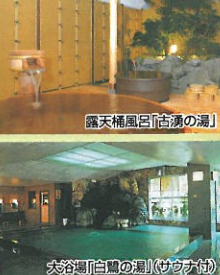
大浴場「白狐の湯」(サウナ付)

■お料理・お部屋基本プラン宿泊料金/お一人様1泊2日・客室定員利用/サービス料・消費税・入湯税込 (単位:円)