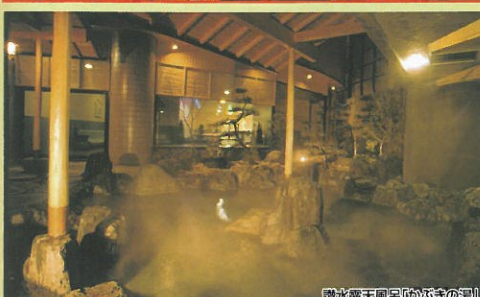
露天風呂「白狐の湯」

カラオケ 無料・割引サービス (宴会時)15名様以上 無料 14名様以下 12,000円(税込) 50%割引 ⇒ 6,000円(税込)