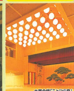
大宴会場「ことひら座」

■お料理・お部屋基本プラン宿泊料金/お一人様1泊2日・客室定員利用/サービス料・消費税・入湯税込 (単位:円)