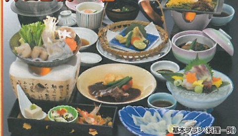
基本プラン(料理一例)