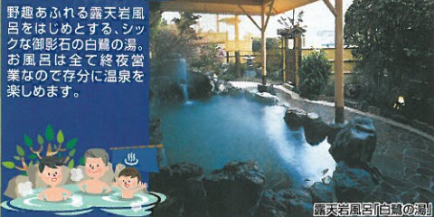
露天風呂「白狐の湯」