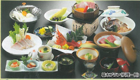
基本プラン(料理一例)