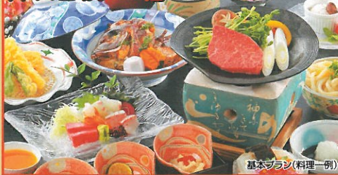
基本プラン(料理一例)